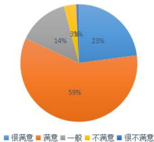
图 2-1 2019 届毕业生对学校满意度

南阳中医药学校 2019 年毕业生总数为 1784 人，通过毕业生就业满意度调查显示，其中很满意人数为 410 人，占比 22.98%；满意的人数为 1052 人，占比 58.97%，两者合计达 81.95%。