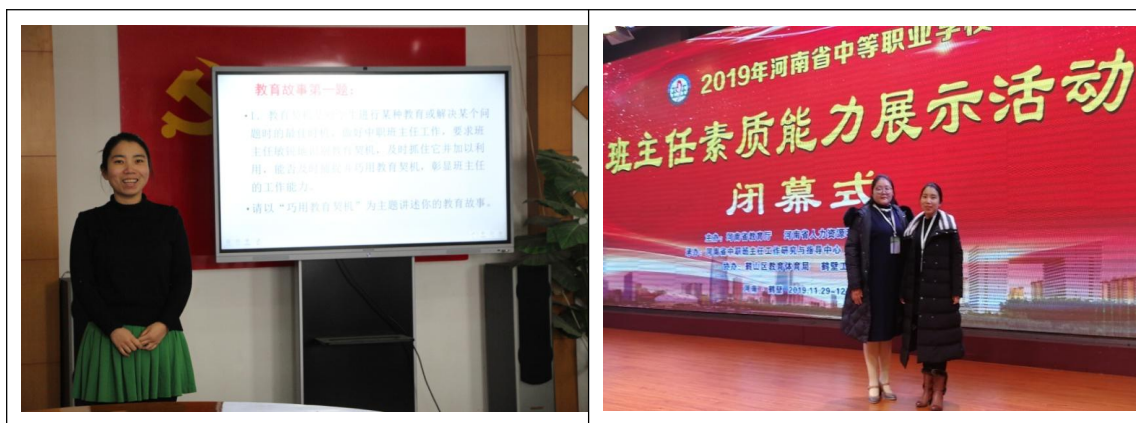
图 7-4 参加省、市中职业院校班主任素质能力展示活动