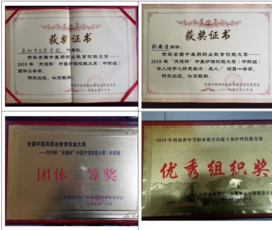
图 7-1 2019 年度各级技能竞赛获奖证书照片